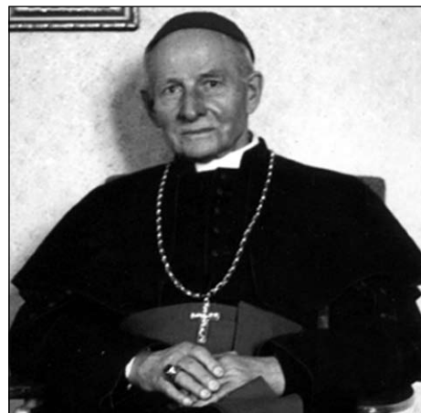
Biskup Ján Vojtaššák