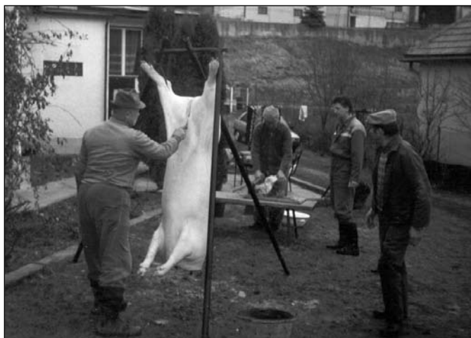
K adventu patrí v Tepličke pravá zabíjačka

nesmel chýbať tzv. postník – kysnutý koláč na vode a bez masti, z ktorého sa na Štedrý deň pripravili makové lokše (bobaľky). Šterý deň bol dňom prísneho pôstu. Ráno zavítali prví vinšovníci – chlapci a muži. Dievčatá a ženy chodili spievať večer po štedrovečernej večeri. Keď sa začalo s prípravou štedrej večere, deti v izbe ozdobovali vianočný stromček – jezulaň. Na štedrovečerný