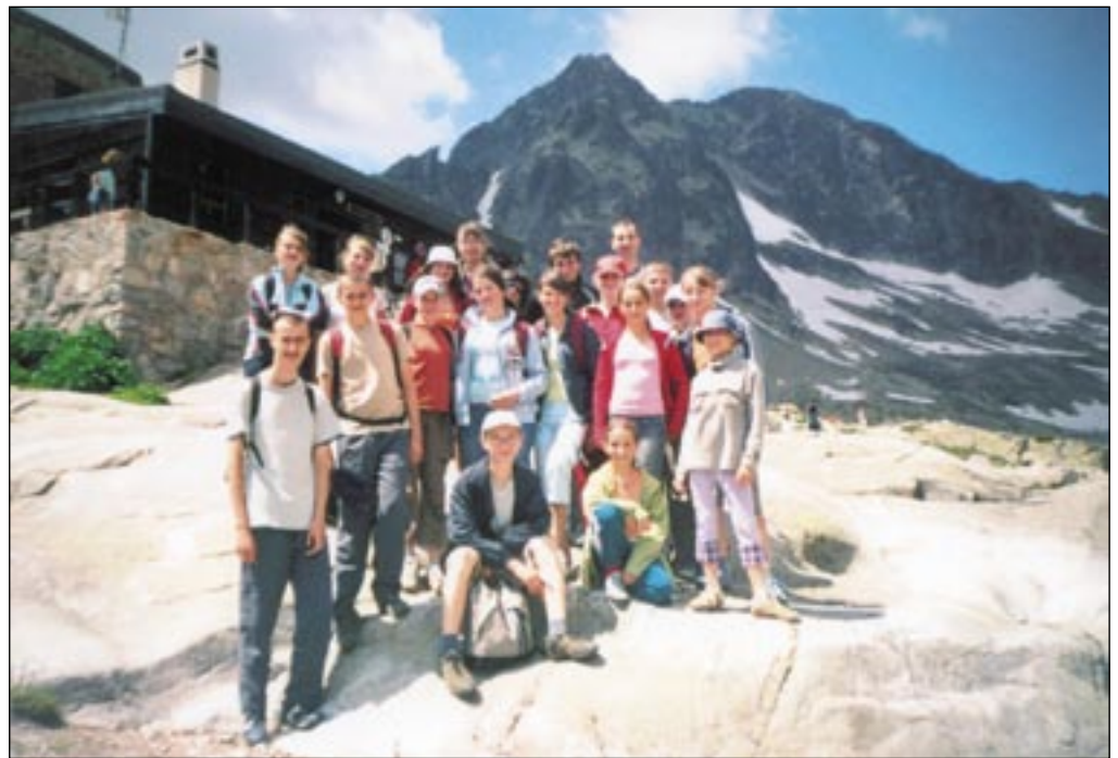
Mládež markušovskej farnosti na výlete v Tatrách

A čo poctivá práca? A pocit zodpovednosti pri