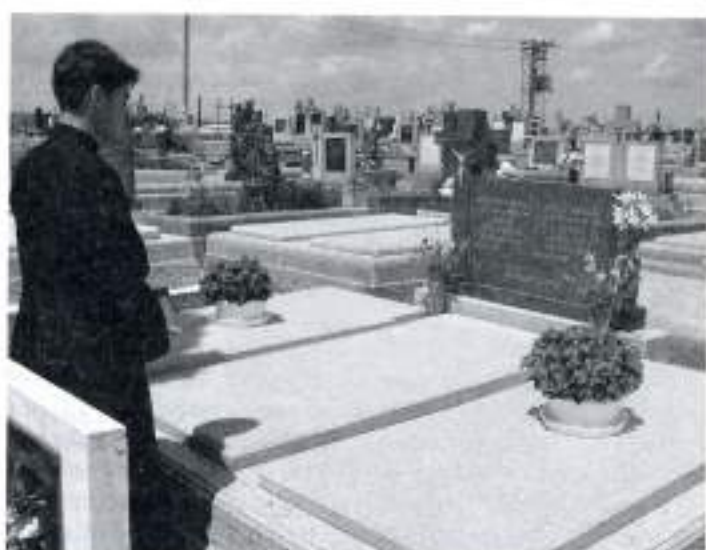
Pri hrobe svojho otca a starého otca