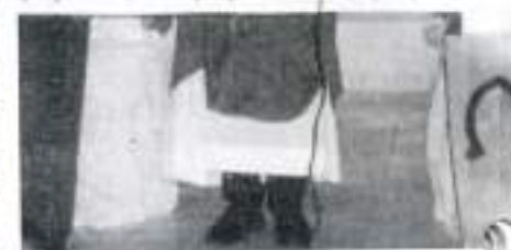
Kňaz premieňa chlieb na telo Pána Ježiša