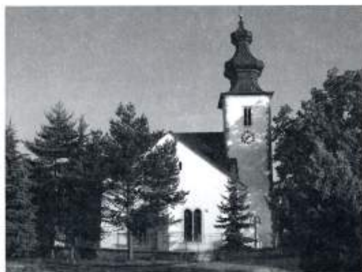
Kostol v Tepličke - tu bol novokňaz pokrstený