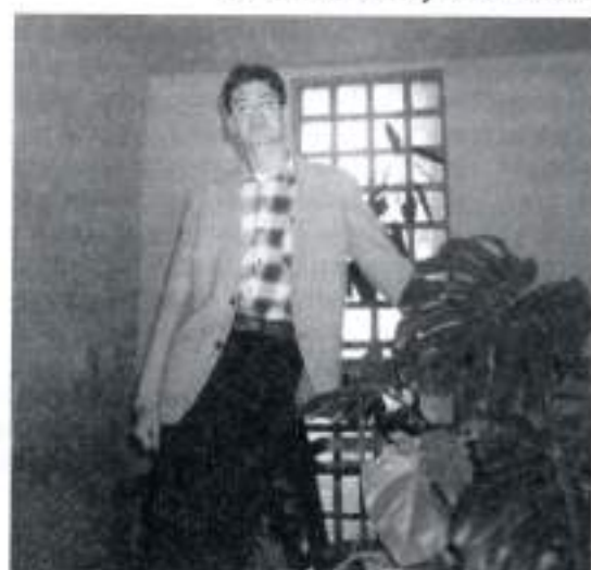
Ako študent gymnázia