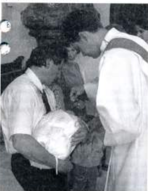
Pri krste dieťaťa