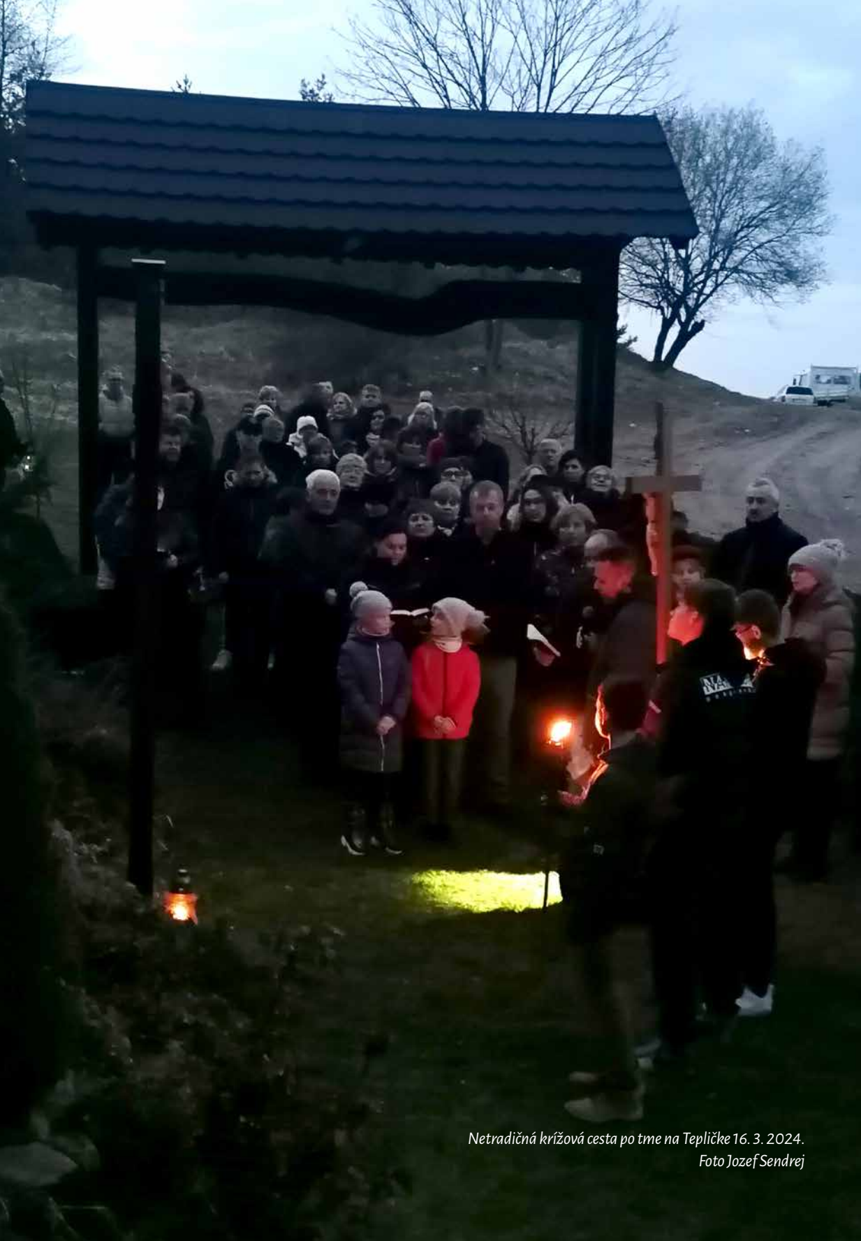
Netradičná krížová cesta po tme na Tepličke 16. 3. 2024.