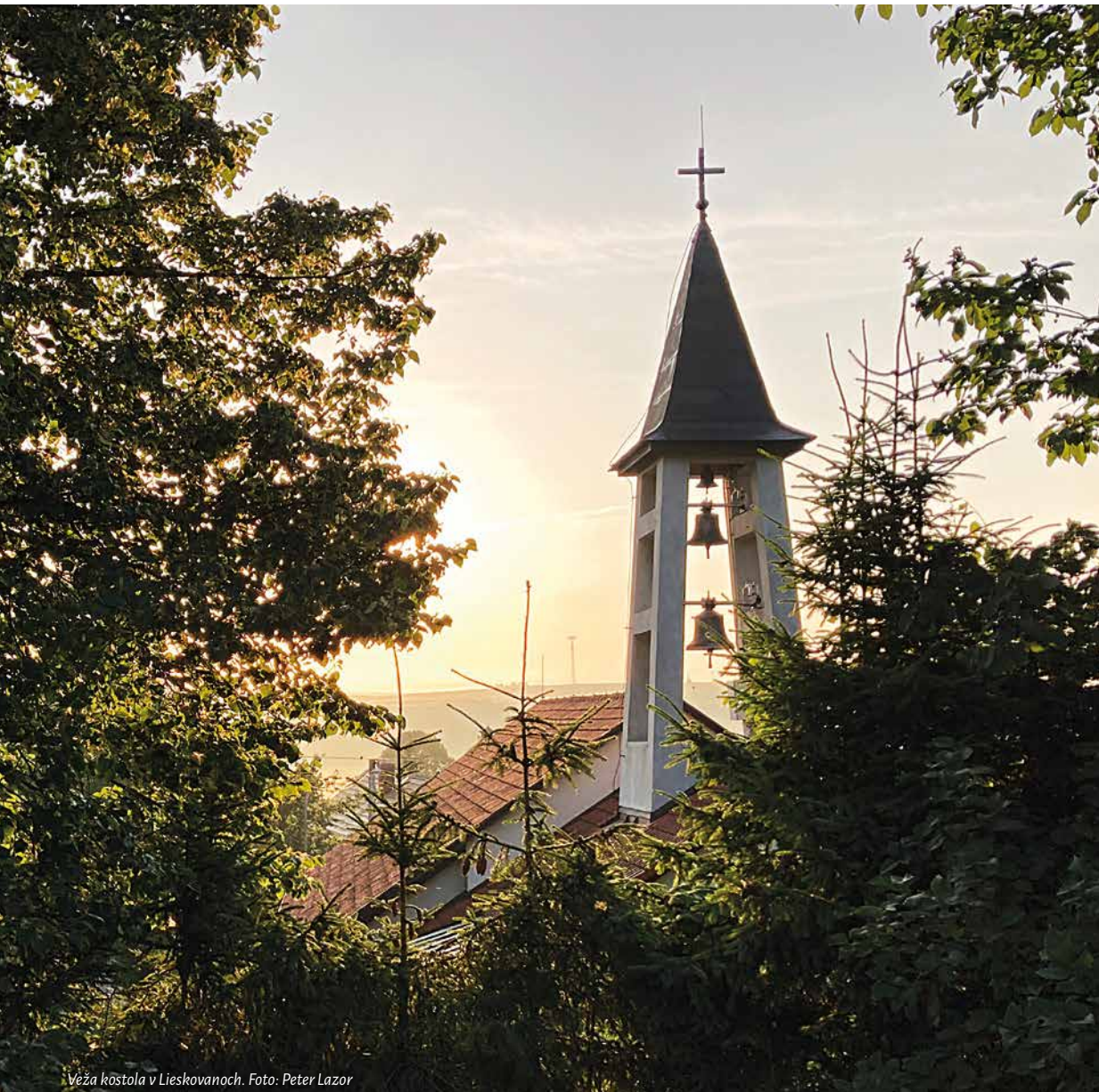
Věžba kostola v Lieskovanoch.