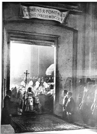
Rím 24.12.1925, otvorenie Sv. brány, pápež Pius

V celej Cirkvi sa 24. decembra 2024 v Bazilike sv. Petra v Ríme otvára Jubilejný rok. V Spišskej diecéze sa otvorenie jubilea uskutoční 29. decembra 2024 v Poprade. Cirkev pozýva všetkých, a zároveň každého jednotlivu, na otvorenie Jubilejného roka aj v našich srdciach, v rodinách v spoločenstvách, v štátoch.